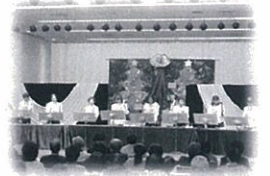
★ハンドベル入門 心に響くトンチャムの音色♪