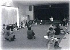
★リトミック教室 リズムと歌で感性をみがく！