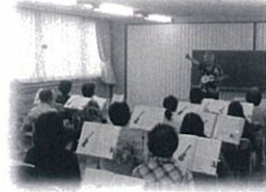
★ウクレレ入門 ポロンとならせば気分はハワイ♪