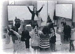
★ABC教室 ハローエブリワン！