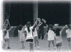
★キッズストリートダンス ステージめざして！