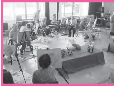
★絵画教室～描く楽しみ 魅力的な油彩画の世界！