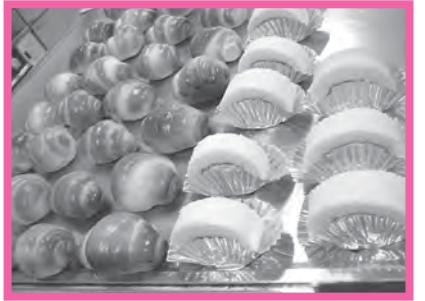
★パンとお菓子の教室 誰でも気軽にプロの味にチャレンジ！