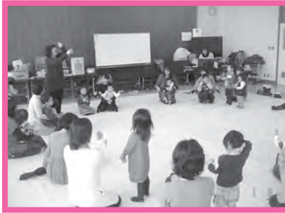
★親子リトミック教室 リズムと歌で感性をみがきます！