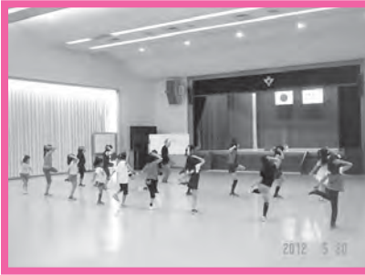
★キッズストリートダンス ステージめざしてレッツダンス！