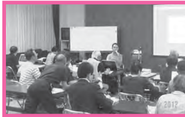
★写真教室・デジタルカメラ講座